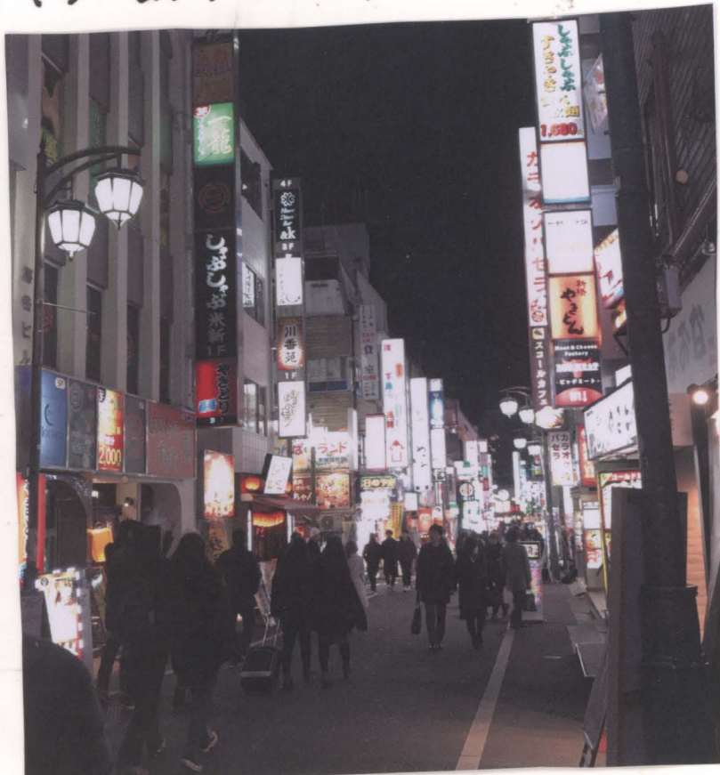
水商売系、無料案内所のキャッチが多く一番危険なエリア。