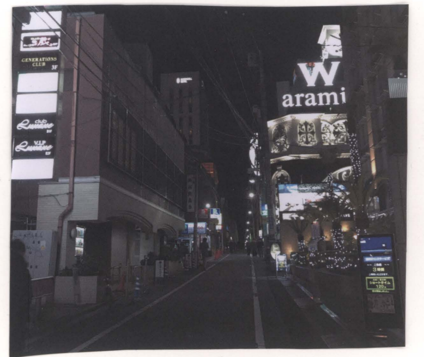
キャッチがはず、人通りがほとんどないエリア。