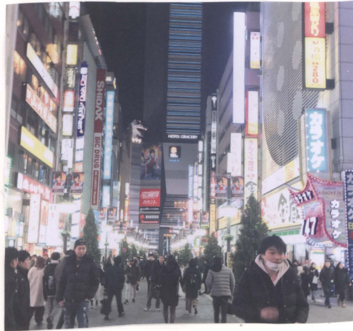
居酒屋のキャッチが一番多いエリア。