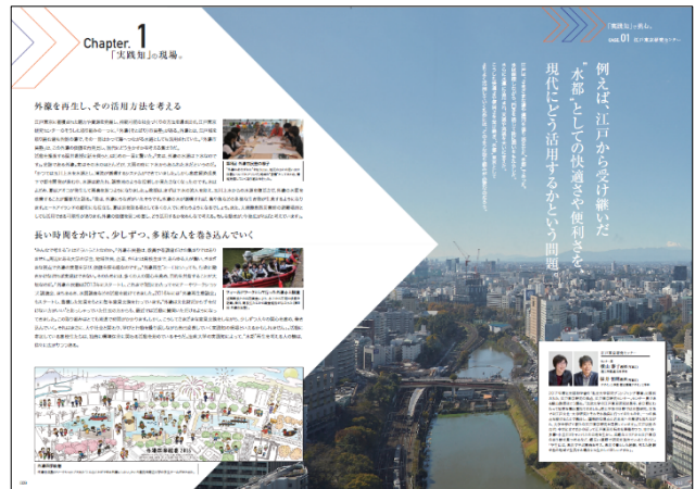
2020 入試大学案内特集ページ