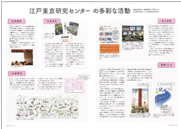
広報誌 HOSEI 特集記事の一部

受験生向けの広報として入学センターが作成する「2020 年度大学案内」の特集ページ「実践知の現場」において外濠市民塾の活動が掲載された。