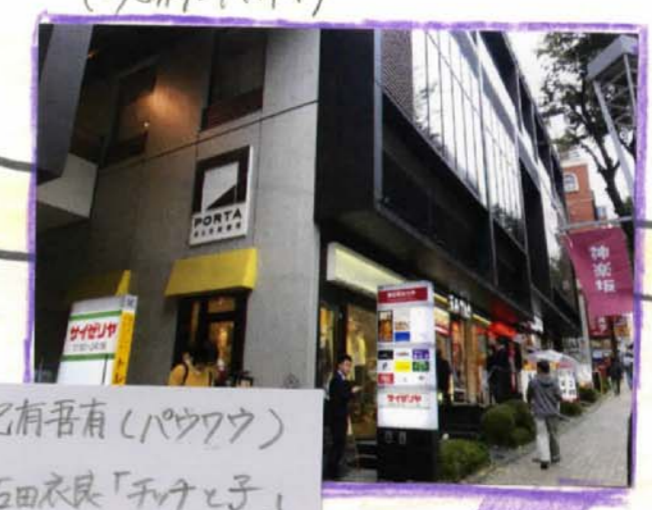
巴有吾有(バウウウ) 石田衣良「チキチキ」