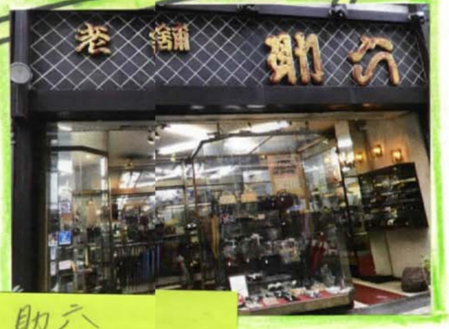
助六 幸田文「濃紺」 (創業明治43年) 下駄E報のビル