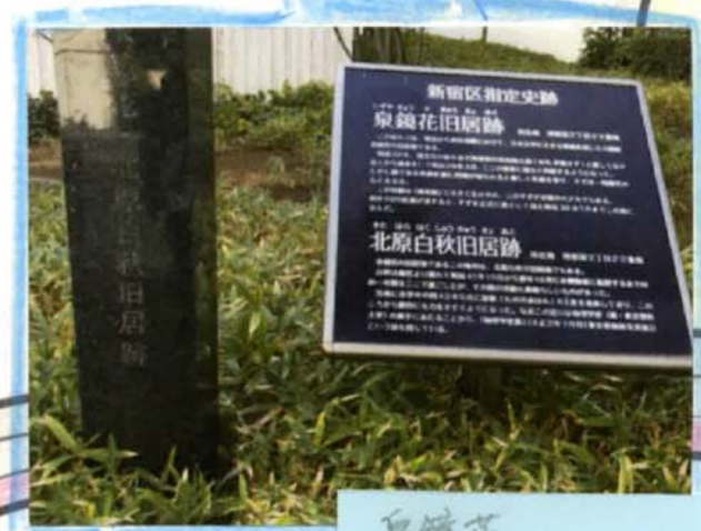
泉鏡花 北原白秋 旧居跡