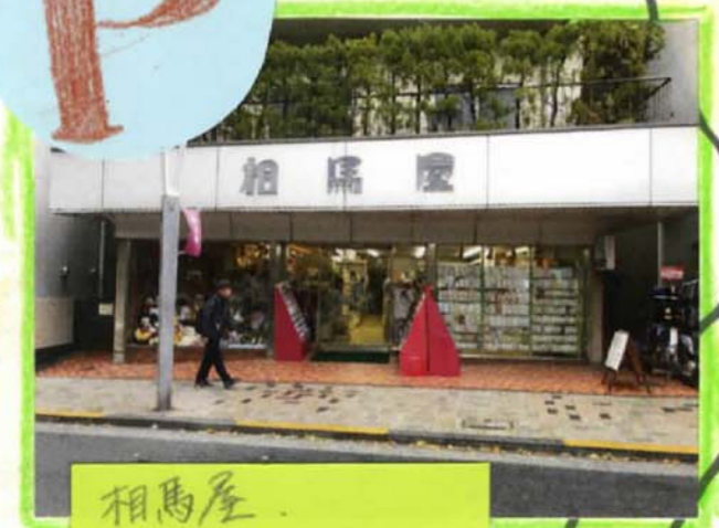
相馬屋 石川啄木「明治の文学」 (創業明治2年(1869)) 今昔も文具屋