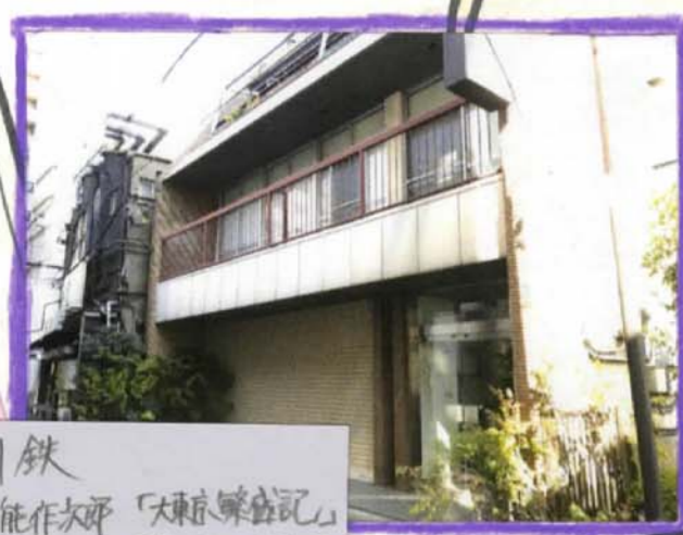
川鉄 加能作次郎「大津家繁盛記」 「早稲田神楽坂」