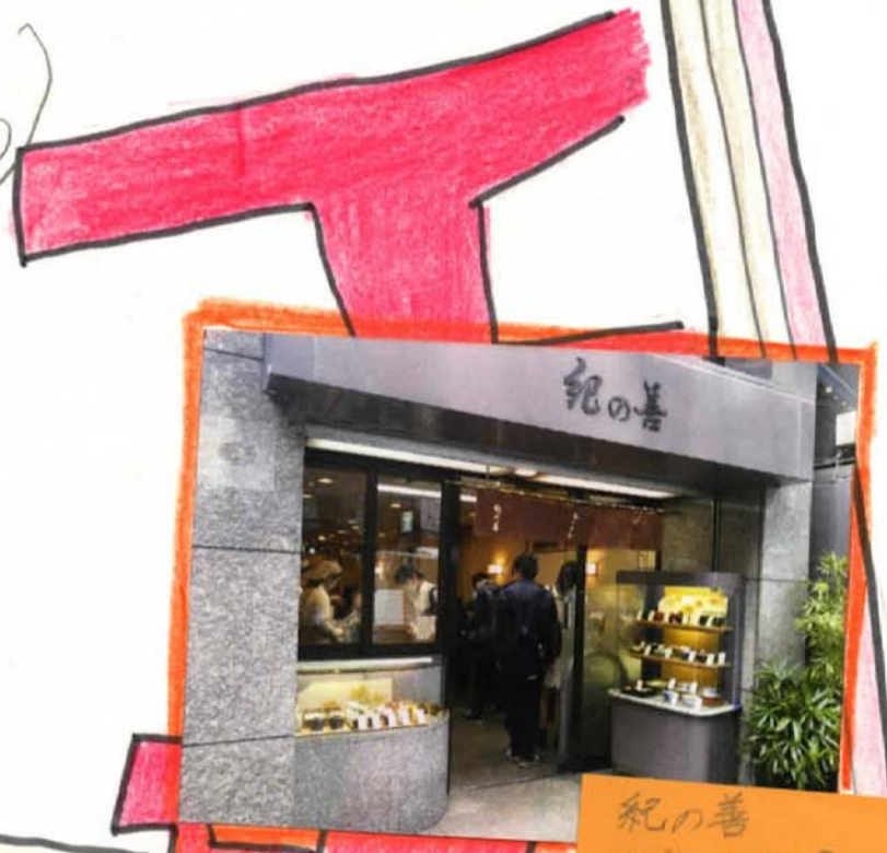
紀の善 加能作次郎 「大津家繁盛記」