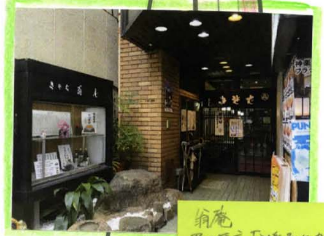
翁庵 黒川健信「神楽坂木曾町旅館」 ドラマ「料亭、以上様」