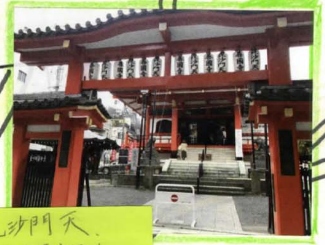
毘沙門天 夏目漱石「坊っちゃん」 ドラマ「料亭、以上様」