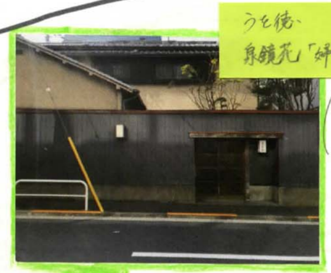
うも徳 泉鏡花「娯楽園」